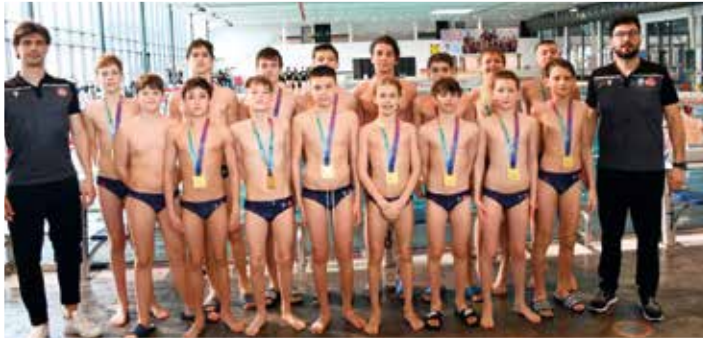
Das U14 Team wird Süddeutscher Meister