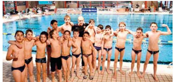
Die Jung-Barracudas sind Süddeutscher U12 Pokalsieger

Am 14. und 15. März kämpften die jungen Barracudas der U12 in Fulda um den Süddeutschen Wasserball Pokal U12 mixed. Die ersten Spiele konnten die Nürnberger eindeutig mit 10:2 gegen die SG Stadtwerke München und mit 9:3 gegen den SC Wasserfreunde Fulda 1923 für sich entscheiden. Im letzten Spiel wartete der SV Cannstatt auf die Barracudas. Nach dem ausgeglichenen ersten Viertel hatten die Barracudas zu ihrem Spiel gefunden und bauten anschließend ihre Führung deutlich aus – bis zum verdienten 14:8-Sieg und damit dem ersten Platz. Trainer Marc Steinberger freute sich über den Auftritt seines Teams: „Die noch sehr junge Mannschaft hat sich sehr souverän bei der Endrunde präsentiert und damit die besten Voraussetzungen für einen Erfolg im deutschen Finale geschaffen.“ Strahlend und stolz nahmen die jungen Spieler ihre Medaillen als Süddeutsche Wasserball Pokalsieger der U12 entgegen.