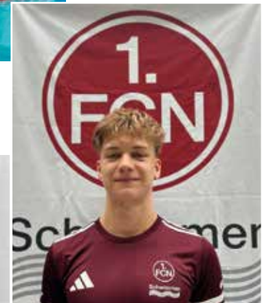
über die 100m Freistil in Berlin. Er hat eine tolle Entwicklung hingelegt!