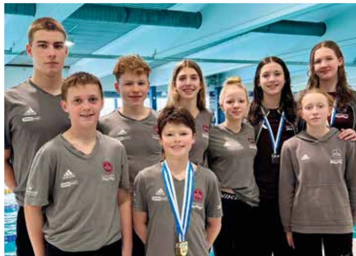
Ein Teil des Langstreckenteams des Clubs

Insgesamt waren die Bayerischen Meisterschaften Lange Strecke ein gelungener Einstieg in die Langbahnsaison. Trotz der Tatsache, dass viele Athletinnen und Athleten direkt aus intensiven Trainingswochen kamen, konnten zahlreiche Medaillen, Titel und Qualifikationszeiten erreicht werden.