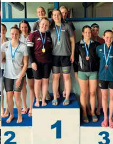
Bayerns schnellste 4 x 100m Lagen Staffel kommt vom Club