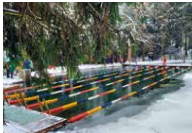
Das eisige Wettkampfbecken im Erzgebirge